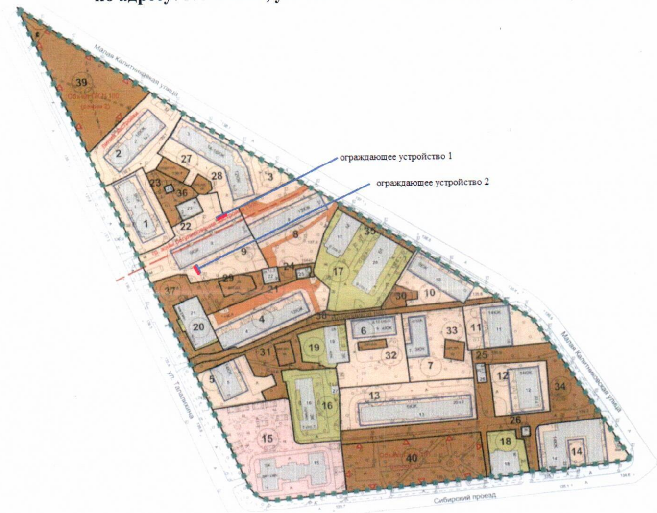
Схема установки ограждающих устройств по адресу: г. Москва, ул. Малая Калитниковская, д. 2 корп. 2

Ограждающие устройства №№ 1, 2 – антивандальные подъемные шлагбаумы