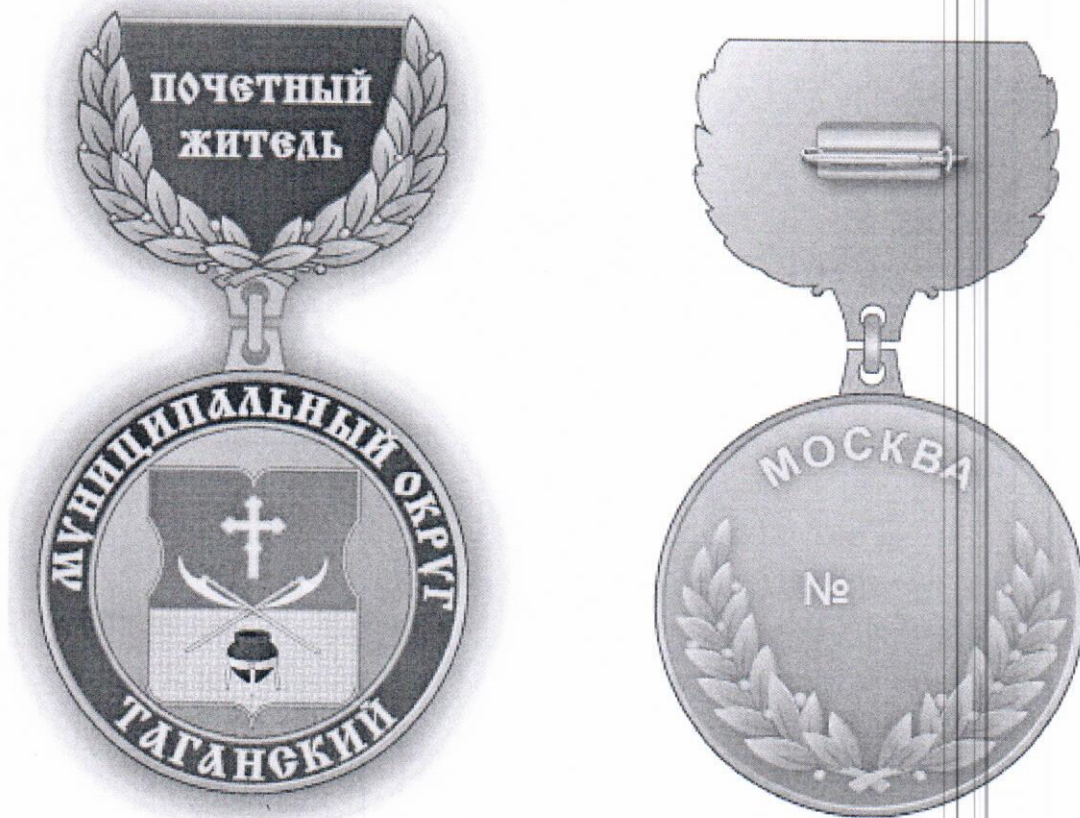
рисунок знака муниципального округа Таганский «Почетный житель муниципального округа Таганский»