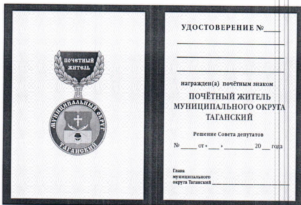
Внутренний разворот Удостоверения, М 1:1